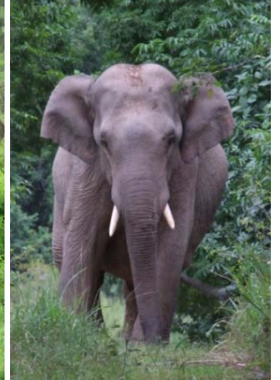
ช้างเอเชีย