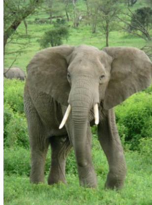
ช้างแอฟริกา

ช้างเป็นสัตว์ที่ใกล้สูญพันธุ์อยู่ในบัญชี 1 (Appendix I) ของอนุสัญญาว่าด้วยการค้าระหว่างประเทศซึ่งชนิดสัตว์ป่าและพืชป่าที่ใกล้สูญพันธุ์ (CITES) ที่ไม่อนุญาติให้มีการค้าระหว่างประเทศ และห้ามนำเข้าส่งออกโดยเด็ดขาด ยกเว้น เพื่อการศึกษา วิจัย และเพาะพันธุ์