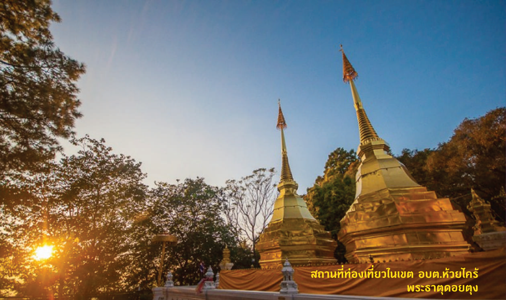
สถานที่ท่องเที่ยวในเขต อบต.ห้วยไคร้ พระธาตุดอยตุง